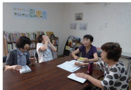
▲ 談笑中のひまわり会の皆さん