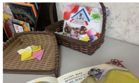
▲ ひまわり会手作りの素敵なおもてなしプレゼント