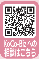
KoCo-Bizへの相談はこちら