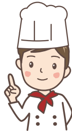
町内でお店を している人