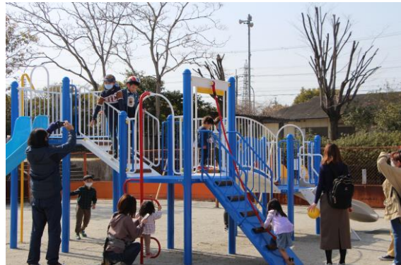
西谷公園に2022年3月に設置されました