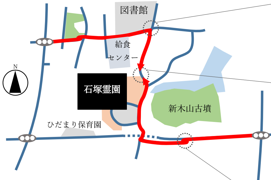
石塚霊園までの地図